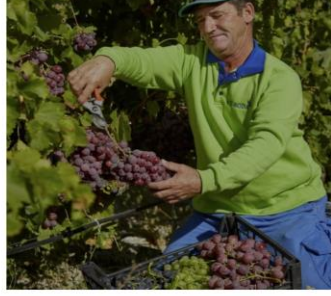
we • care